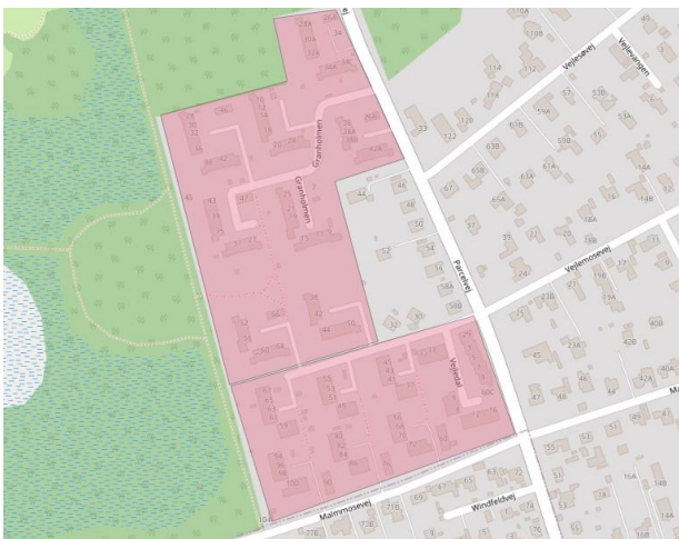
Figur 1: Visualisering af de to boligforeninger. Parcelgården ligger mod nord og Hvide By mod syd.

Boligerne ligger i klynger med hver sin egen centrale, asfalterede gårdsplads, som anvendes til parkering. Antallet af boliger per klynge varierer mellem 5 og 9 boliger.