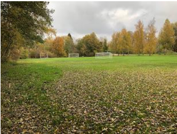
Figur 3: Større græsareal nord for Parcelgården.

Som også nævnt tidligere er der et større græsareal nord for Parcelgården, som i dag anvendes som en boldbane. Området er kommunalt ejet, men ifølge foreningernes bestyrelsesmedlemmer har de været i kontakt med Rudersdal Kommune, som på daværende tidspunkt var positivt stemt for, at foreningerne kunne bruge arealet til en fælles opvarmningsform. Men kommunen har fremhævet at der bl.a. er behov for en konkret vurdering og afklaring af, hvad der kan lades sig gøre i forhold til fredninger mv. i området. Arealet vurderes at have en størrelse på ca. 7.500 m 2 . Derudover er der også et antal mindre græsarealer, som foreningerne selv råder over.