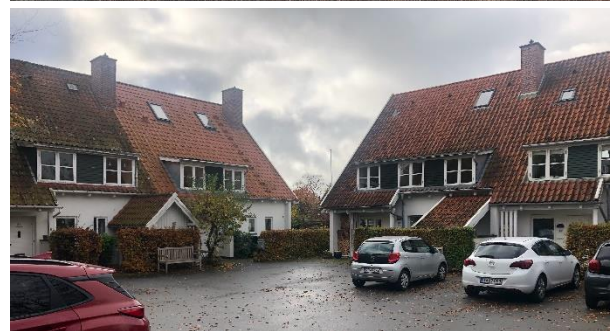
Figur 2: Øverst: Eksempel på klynge i Parcelgården. Nederst: Eksempel på klynge i Hvide by.

Boligerne i Parcelgården er fredede, hvorfor der er strenge krav til, hvad boligejerne må mht. deres boliger. Der må bl.a. ikke opstilles tekniske anlæg på ydersiden af bygningerne. Dog er det potentielt muligt at placere anlæggene længere væk, fx i bagenden af haven. Hvide By er ikke underlagt lige så strenge krav.